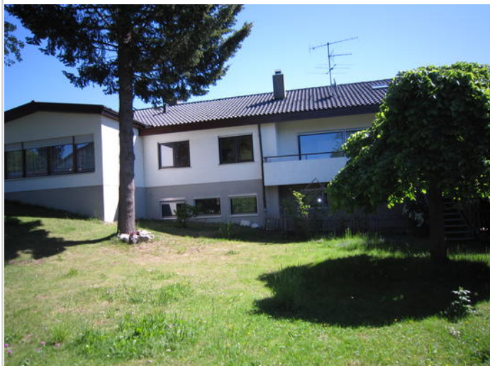
Powered by InPro Immobilien

Zimmer: 12,00 Wohnfläche ca.: 357,00 m 2 Kaufpreis: 277.000,00 EUR