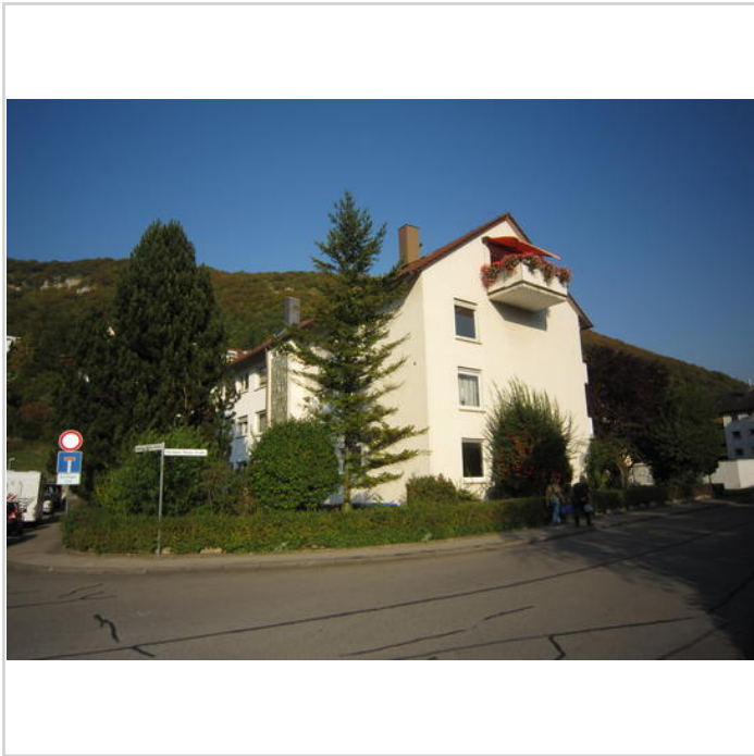
4- Fam. Haus

Zimmer: 3,50 Wohnfläche ca.: 88,50 m 2 Kaufpreis: 99.000,00 EUR