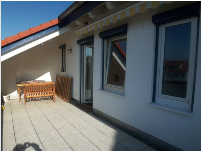
2 x Dachterrasse

Zimmer: 3,50 Wohnfläche ca.: 94,80 m 2 Kaufpreis: 199.000,00 EUR