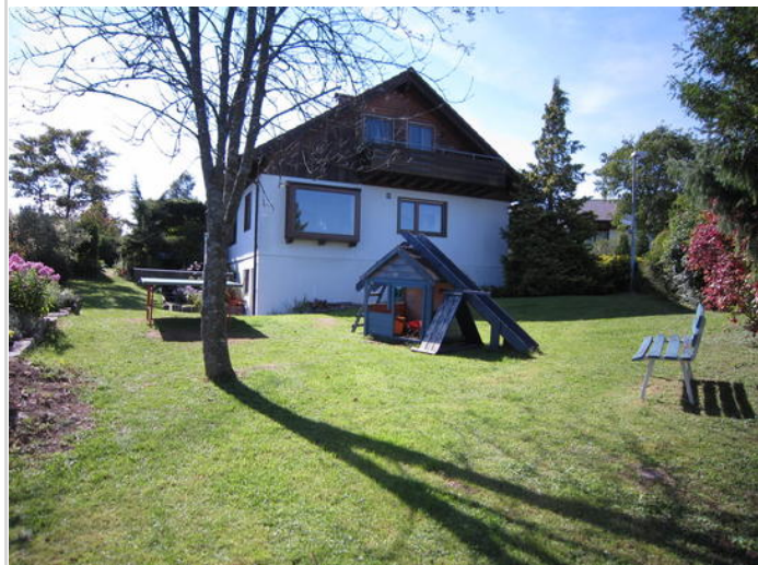
großes Garten dabei

Zimmer: 5,50 Wohnfläche ca.: 137,00 m 2 Kaufpreis: 259.000,00 EUR